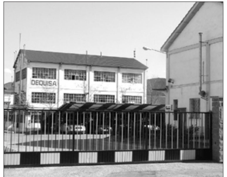
Exterior de la fábrica Dequisa. M.P.

Si los trabajadores hoy aprueban el principio de acuerdo, éste se firmará definitivamente con fecha de validez de 30 de abril. "La producción se acaba en Dequisa el próximo día 15 y está previsto que hasta el 30 se haga la limpieza de las instalaciones